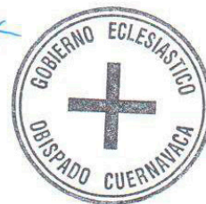
✠ Ramón Castro Castro Obispo de Cuernavaca

Dios recompense su ministerio sacerdotal y su vida entregada a favor del Reino de Dios.